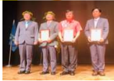
協會代表大會(通訊優等)