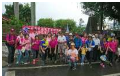
區會夫婦幹部聯誼