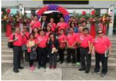
協會會員代表大會