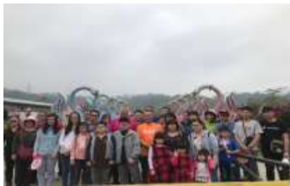
108年社員教育(旺萊山愛情大草原)