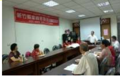
愛鄉協會溫校長帶動音標的運用