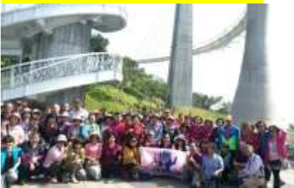
108年社員教育(岡山之眼)