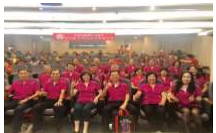
社幹部教育研習活動