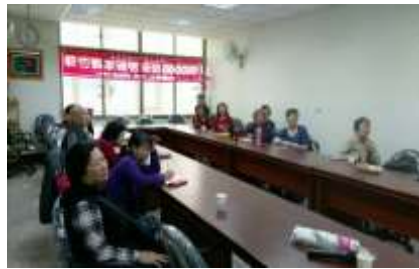
學員每位認真學習