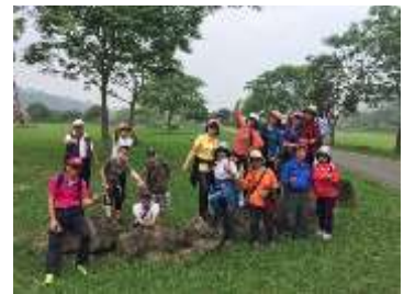
108社員教育(嚴教育主席帶隊)