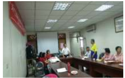
溫校長與長官互動未來客語活動