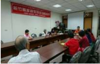
謝薪傳師如何再造活化客語環境