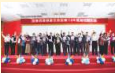
▲ 協會會員代表大會