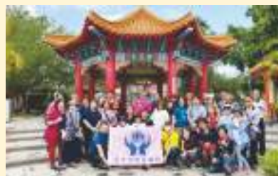
▲ 第三梯次埔里酒廠合影