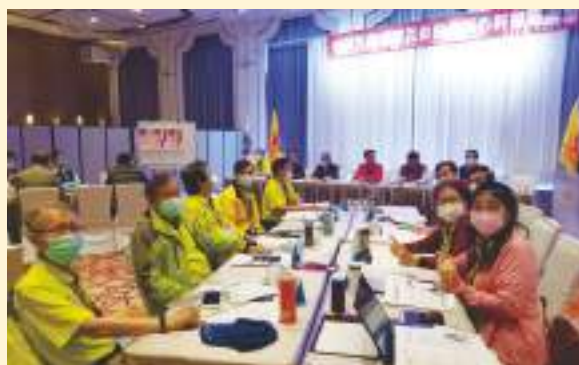
▲ 110年區會核心幹部研習