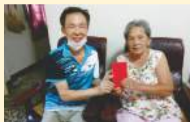
▲ 110年重陽敬老金發放