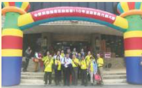
▲ 110年參加協會社代表大會