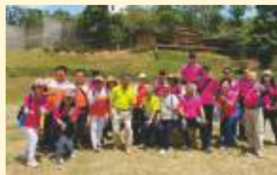
▲ 新竹區會夫婦幹部聯誼