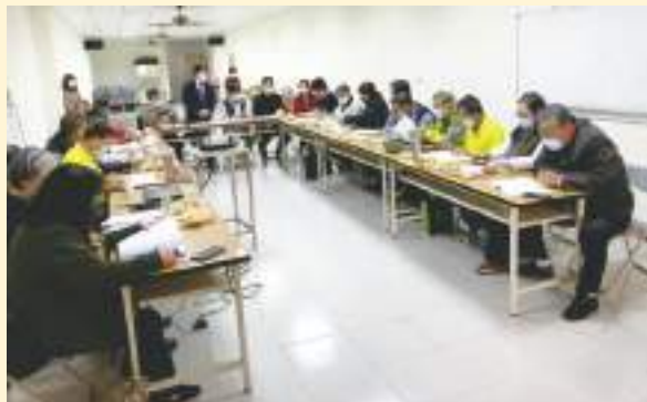
▲ 110年社代表座談(年)會