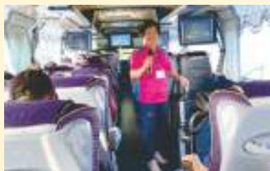
▲ 第一梯次社員教育