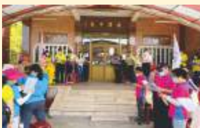
▲ 慶祝國際儲蓄互助社節