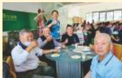
▲ 梅開研醇觀光工廠