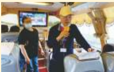
▲ 第三梯次社員教育