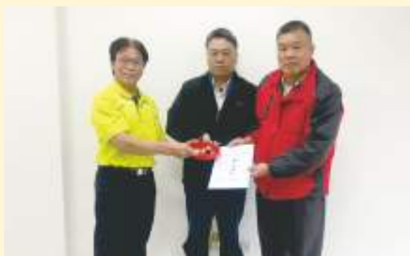
▲ 110年區會新(卸)任主委交接