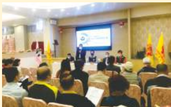
▲ 110年社理事長研習課程