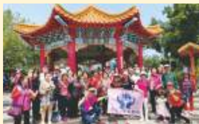
▲ 第二梯次埔里酒廠合影