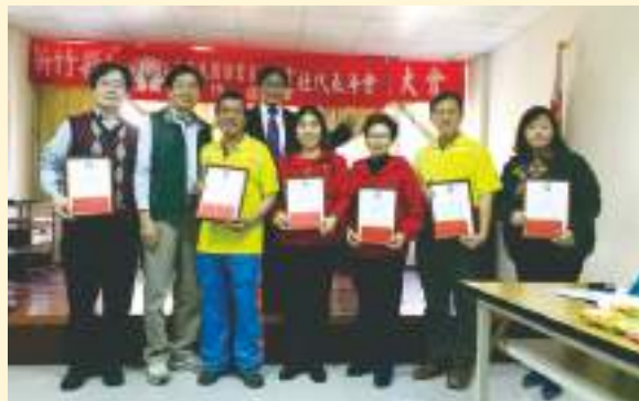
▲ 110年社代表座談(年)會獲獎單位