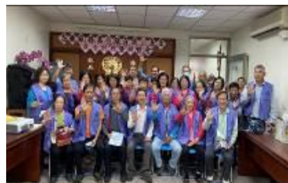
志願服務隊年終工作會報合影