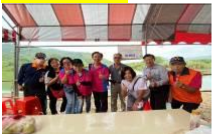
結合上林社區蘿蔔節