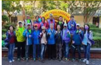
參加志工表揚合影