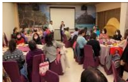
社理事長聯誼活動