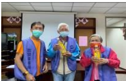
志願服務隊表揚優良志工