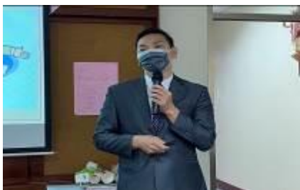
志願服務隊志工訓練