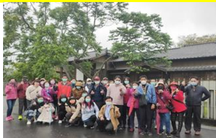
第一梯次社員教育(2)