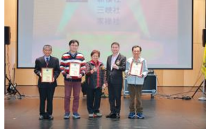
協會代表大會(通訊優等)