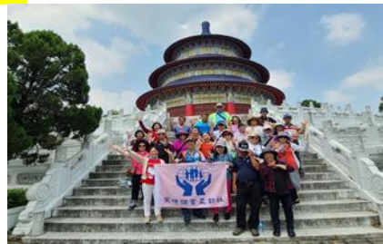
第二梯次社員教育(1)