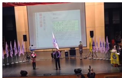
協會會員代表大會(新竹區會)