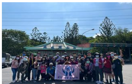
第三梯次社員教育(1)