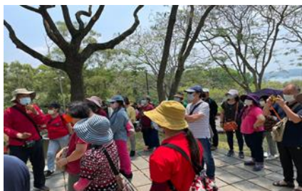
第二梯次社員教育(2)