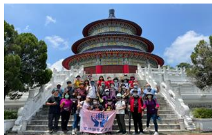
第三梯次社員教育(2)