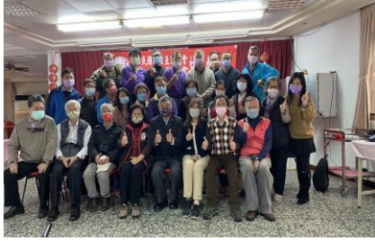
新竹區會 111 年會