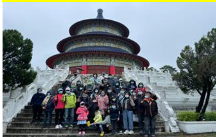
第一梯次社員教育(1)