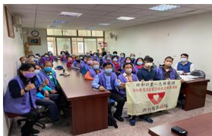
志工訓練全體合影