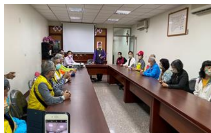
彰化區會蒞社參訪