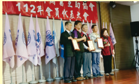
▲ 協會代表大會(通訊優等)