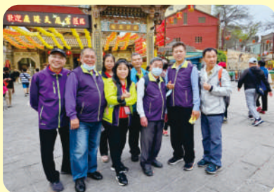
▲ 協會會員代表大會(新竹區會)