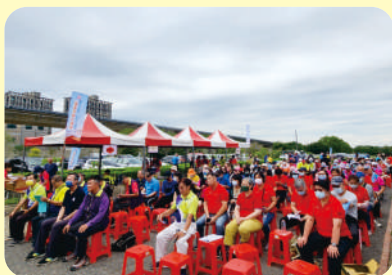
▲ 區會慶祝國際儲蓄互助社節