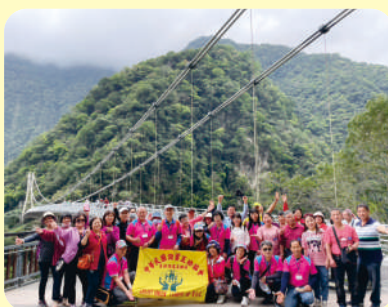
▲ 第二梯次社員教育