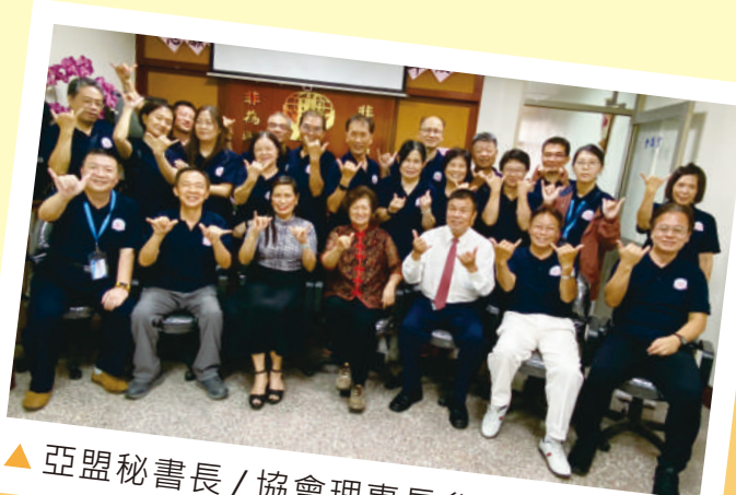
▲ 亞盟秘書長 / 協會理事長參訪家祿社

愛的團隊，不是因為少數人做了很多，而是因為我們大家都做了一點點，讓我們持續以微薄之力，攜手連心，讓家祿更美好。進入家祿時，請脫去煩惱，踏出大門請帶著快樂回家！