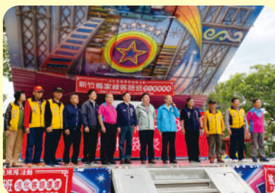
▲ 全國客語活化班成果發表