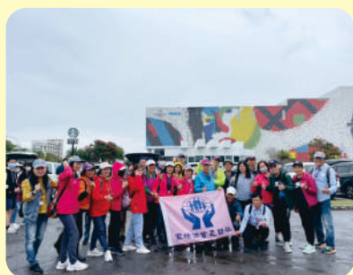
▲ 第一梯次社員教育