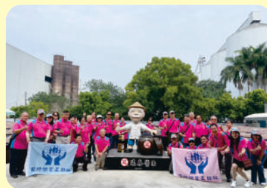
▲ 參訪協會及勘查共購食安