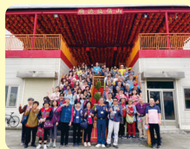
▲ 第三梯次社員教育