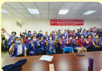
▲ 志工訓練全體合影