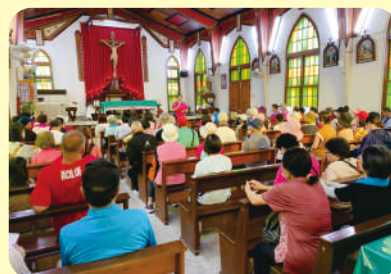
▲ 社舉辦國際儲蓄互助社節