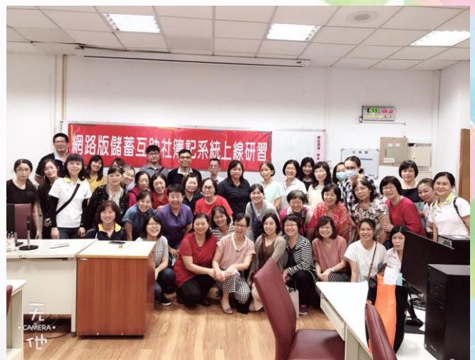
專職簿記系統線上研習