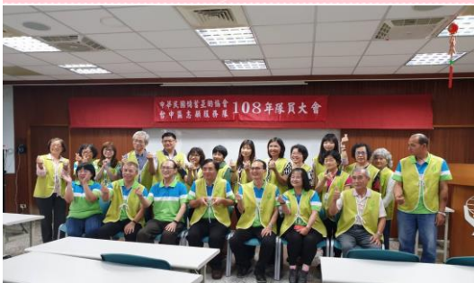
↑ 4/20志工年會花博志工合影