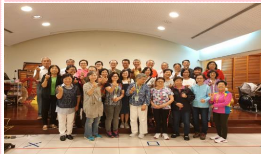
↑ 4/29香港聖雲仙儲互社參訪