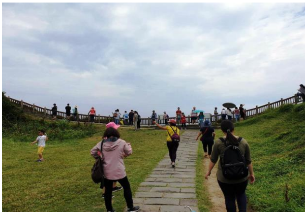
↑ 藍天綠地白雲，多麼賞心悅目的組合啊!!

緊接著是 藍灣拉拉車+牛舌餅DIY 的行程。搭乘 藍灣拉拉車 時，導遊還會詳細的跟大家講解附近的景點，一路上還有工作人員在帮大家攝影拍成影片呢! 牛舌餅DIY 更是一個新的體驗，吃到自己手工製作的牛舌餅感覺更加的美味了!!