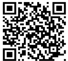
輕鬆掃一下，就可以看到藍灣拉拉車的影片囉!