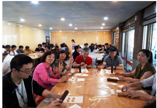
↑ 我們要開始製作好吃的牛舌餅了~

緊接著是 藍灣拉拉車+牛舌餅DIY 的行程。搭乘 藍灣拉拉車 時，導遊還會詳細的跟大家講解附近的景點，一路上還有工作人員在帮大家攝影拍成影片呢! 牛舌餅DIY 更是一個新的體驗，吃到自己手工製作的牛舌餅感覺更加的美味了!!