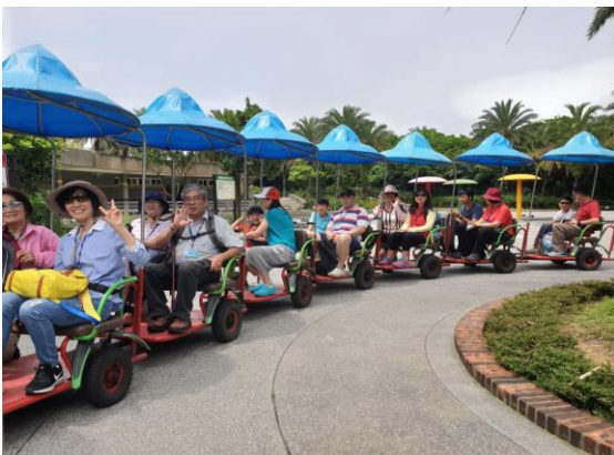
↑ 藍灣拉拉車準備出發了，來張合張吧~~

相信應該大部分的人都是第一次聽到這個旅遊景點，外加上 藍灣拉拉車 的行程，也因此格外的吸引人想要參加，短短的一個禮拜 3 部遊覽車馬上就額滿了。即使如此，願意排候補的社員還是不少，在此只好對這些沒有跟上的人說聲抱歉!!!