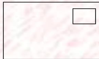
橫式作品背面黏貼位置