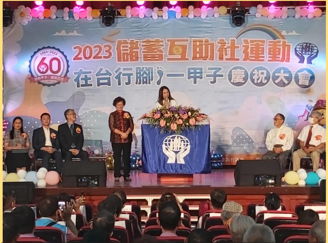
▲ 於新竹新竹縣政府大禮堂舉行

「2023 年儲蓄互助社運動在台灣深耕 60 周年，立法 26 週年並慶祝國際儲蓄互助社節」