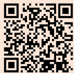
好命退休 聰明理財平台