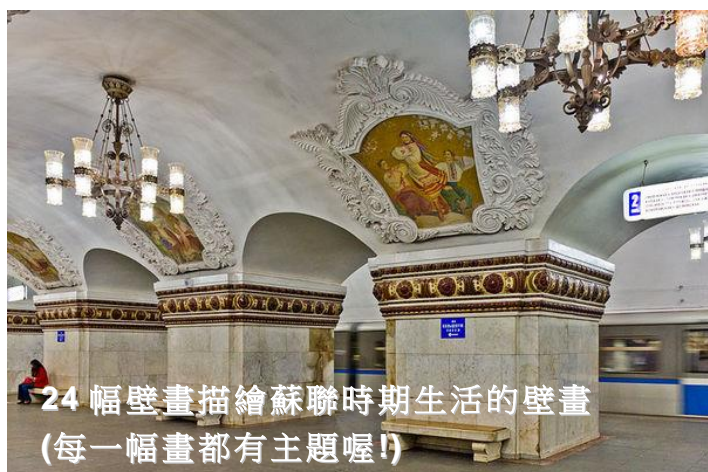
24 幅壁畫描繪蘇聯時期生活的壁畫 (每一幅畫都有主題喔!)

冬宮又名隱士盧博物館，原本是俄羅斯沙皇們的皇宮殿堂，但藉由凱薩琳女皇的擴建，變成了她收藏私人美術品的地方，博物館展示走廊合計約 20 公里、房間及宮殿數量就超過 1000 間，其大已足以傲視群倫，而其豪華富麗，更是博物館中少見。目前收藏 300 萬件來自世界各地的藝術珍寶，其中又以 2 件鎮宮之寶達文西的「拿著花的聖母」和「聖母與嬰兒」這兩幅真跡畫作最有看頭，據說館藏若每二分鐘看一件，也要 27 年才能看完。難怪與大英博物館、羅浮宮、美國大都會博物館同列為世界四大博物館。