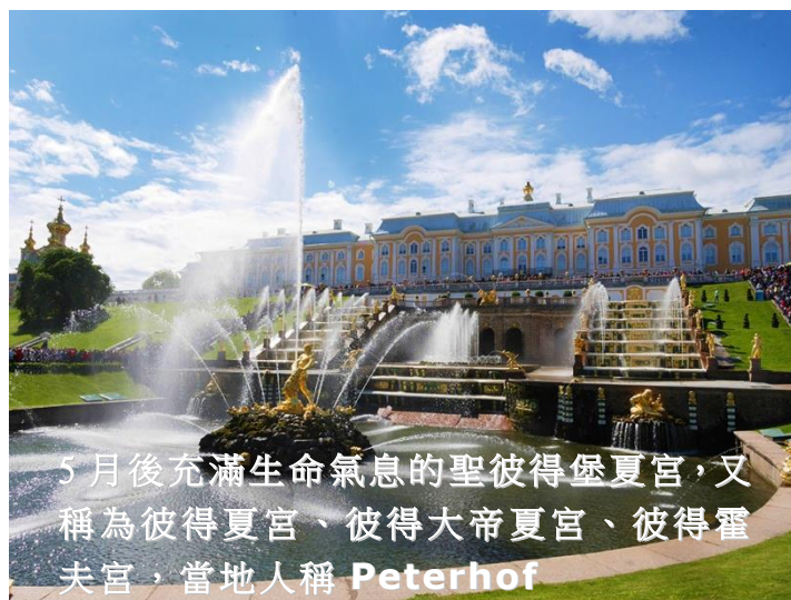
5月後充滿生命氣息的聖彼得堡夏宮，又稱為彼得夏宮、彼得大帝夏宮、彼得霍夫宮，當地人稱 Peterhof

到聖彼得堡必訪的 2 個景點，夏宮座落於芬蘭灣旁，它是彼得大帝於 1709 年戰勝瑞典後，為犒賞自己並炫耀戰爭成果所建，整個區域分成「上花園」和「下花園」兩大區塊，上花園為英式庭園設計，下花園為面海的園區，兩大花園以大宮殿居中隔開。花園的造景則利用複雜的地下水管線路，建造了數十座噴泉，成為夏宮最特別的景觀。