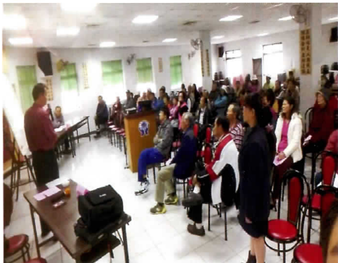
舉辦 105 年社員大會一隅