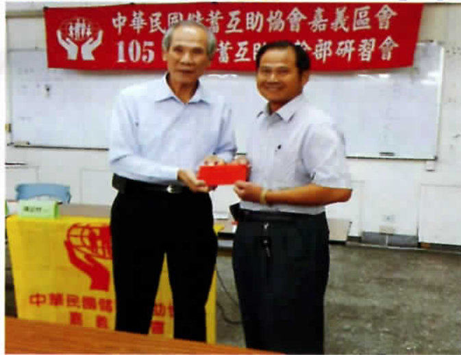
參加幹部研習會出席人數第一名