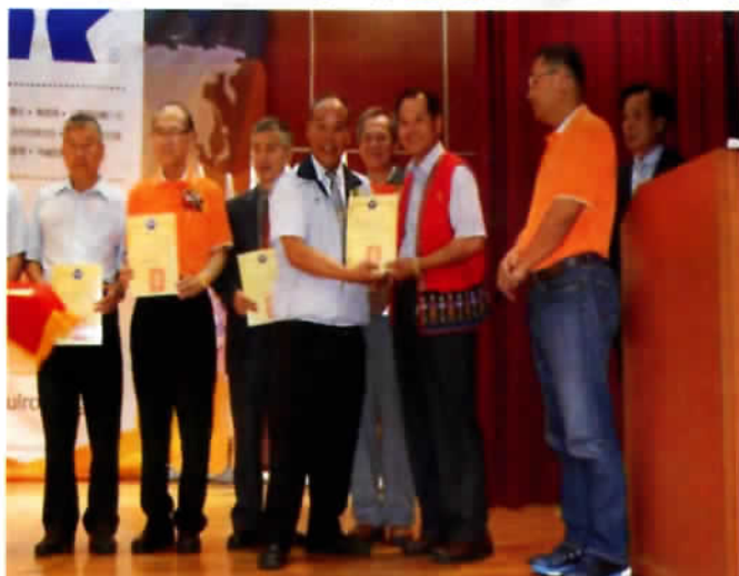
協會通訊評比獲頒佳作獎