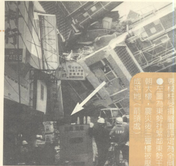
●右圖為南投縣敬宗社，主要樑柱受損嚴重評定為全倒。 ●左圖為東勢社緊鄰東勢王朝大樓，震災後二層樓被壓成平地(箭頭處)