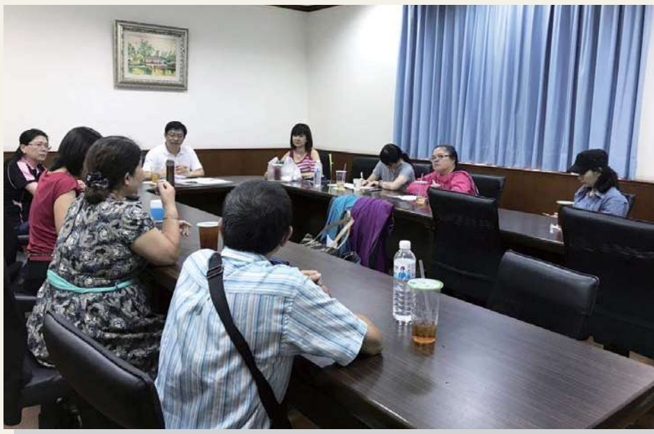
• 參加脫貧方案（平民銀行計畫）的社員，與大家分享她的奮鬥故事

60歲應該是屆齡退休享福的年紀，但這位仍在辛苦工作的單親媽媽，最後愉快的笑著述說她的期待、夢想，略顯疲累滄桑的臉龐卻洋溢著光彩。她告訴我們曾經仰賴社會救助的小小人物也能站起來進而擁有自己的資產，辛苦的人生也還能有夢想，她仍一直努力著！