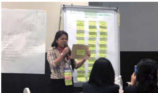
• 研討會成員報告該組產品的優劣評估

已偏老齡化的國家，並非要有年輕社員的加入才能將新的技能與傳統的服務理念相結合。這為期三天研討會所討論的成果，可以讓青年及婦女等弱勢族群湧現自我的價值、發揮儲蓄合作組織獨特的服務功能，亦可為社會的發展和環境真正作出貢獻。本研討的目的係建議各國的儲蓄合作組織均可參酌採用本商業發展服務模式為社員產品發展企業，並制定出發展計劃。