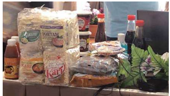
• 馬來西亞監獄儲蓄合作組織展式相關產品