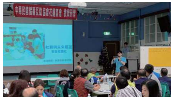
• 花蓮縣東華校園社分享社務與未來展望