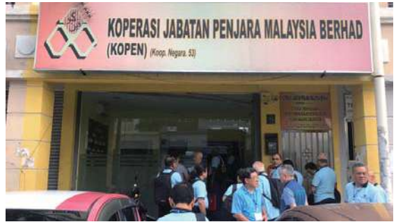
• 馬來西亞監獄儲蓄合作組織辦公室