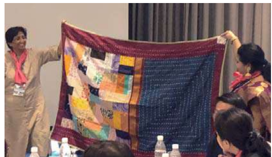
• 研討會成員分享社員所製作之產品