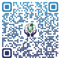
FB QR CODE