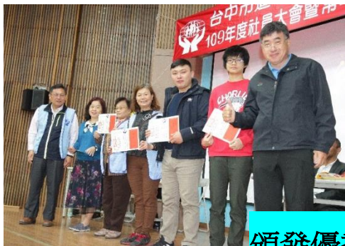
頒發優秀同學們獎學金