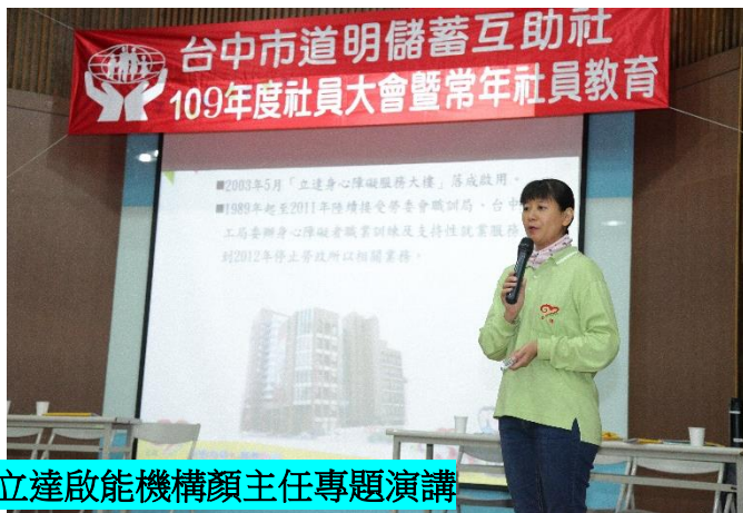
感謝立達啟能機構顏主任專題演講